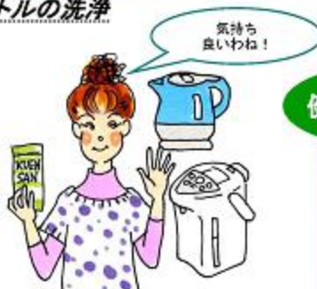
※ ポットの取り扱い説明書を読んでね。

ポットの満水ラインまで水を入れ、1ℓあたりクエン酸大さじ2杯を入れます。沸騰したらスイッチを切り、1時間程度そのままにし、お湯を捨てます。こびりついている汚れは、メラミンスポンジで軽くこすり、最後に水でしっかりすすげば完了です。