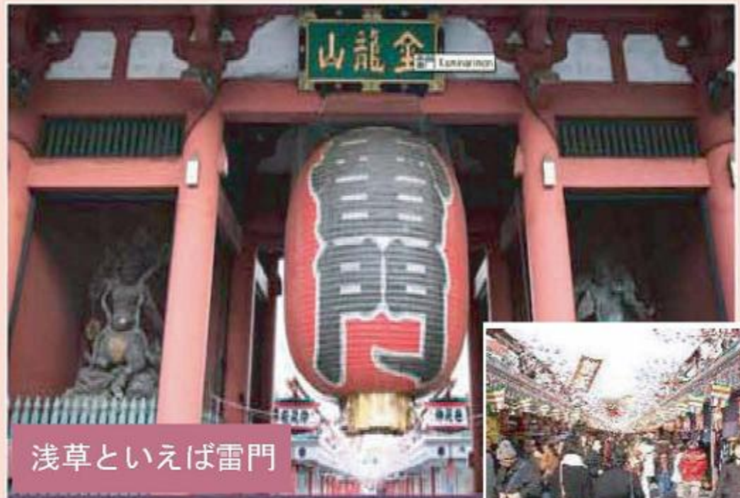
浅草といえば雷門