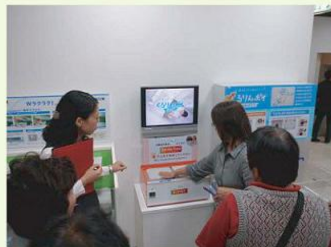
ショールーム見学